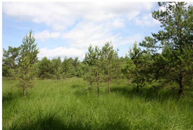
Blick ins Bültsmoor in Richtung Norden