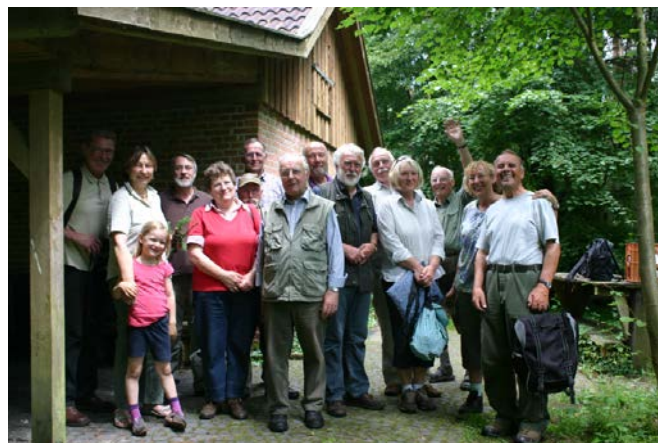
Teilnehmer nach der Mittagspause