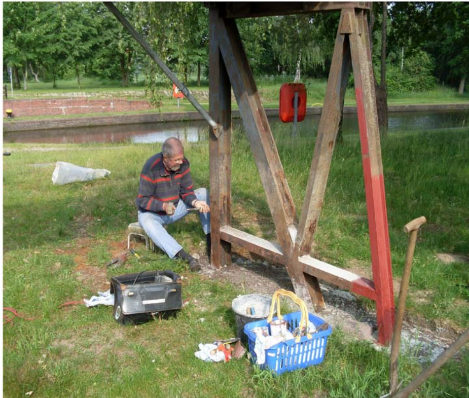
Der zweite Wehrbock wird von Rost befreit.